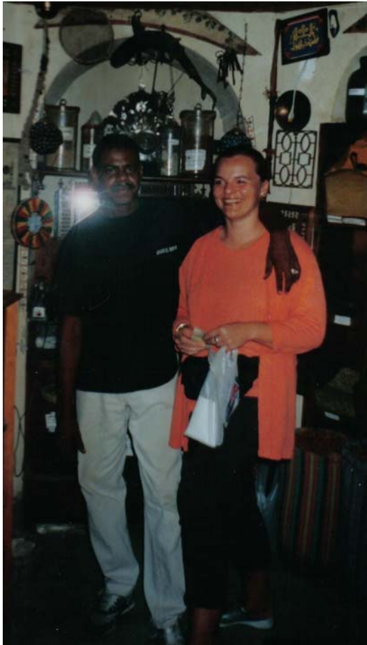
Abb.5: Unglaublich, wie lang so ein Arm sein kann!

gelungenes Bild, wenn man sich darauf umarmt (s. Abb.5) – vorher wird man nicht entlassen. Dieser Körperkontakt ist bereits deutlich mehr, als die meisten Ägypter bis zum Tag ihrer Hochzeit mit einer familienfernen ägyptischen Frau jemals haben werden.